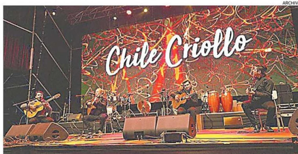
EL GRUPO CHILE CRIOLLO VUELVE COMO FLAMANTE GANADOR DE LA COMPETENCIA DEL AÑO PASADO.