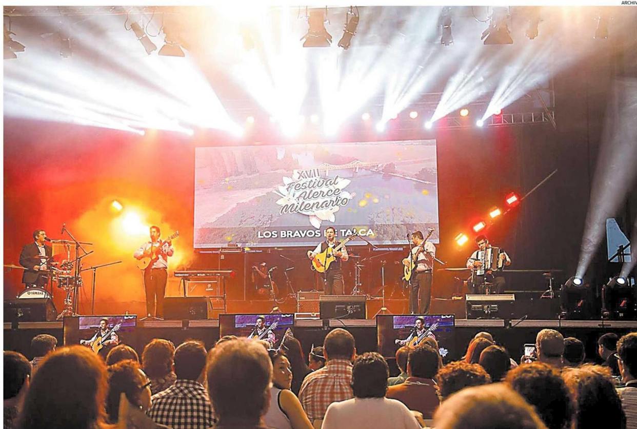
ENTRE LOS saltos más significativos del festival se cuenta haber tenido versiones en el gimnasio municipal de La Unión y al aire libre en el recinto bancario.

Evento cultural se podrá ver por streaming con cinco canciones en competencia y tres grandes invitados. La jornada también estará marcada por el repaso de momentos históricos y una campaña de difusión del patrimonio local y de reactivación económica de diversos emprendimientos.