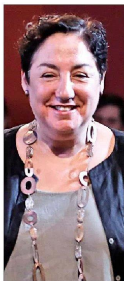
La candidata del Frente Amplio, Beatriz Sánchez.