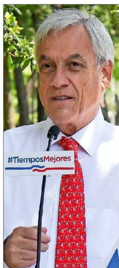
El ex Presidente Sebastián Piñera.