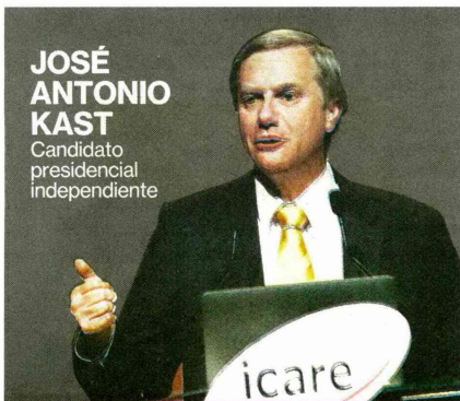
JOSÉ ANTONIO KAST Candidato presidencial independiente

“Tuvieron que atajarme para no levantarme a aplaudir a Beatriz Sánchez. Me habría encantado que me hubiera pedido el mismo video (que proyectó de ME-O) para ir a la CUT, porque a mí sí me discriminaron para ir a la CUT y con escándalo público”.