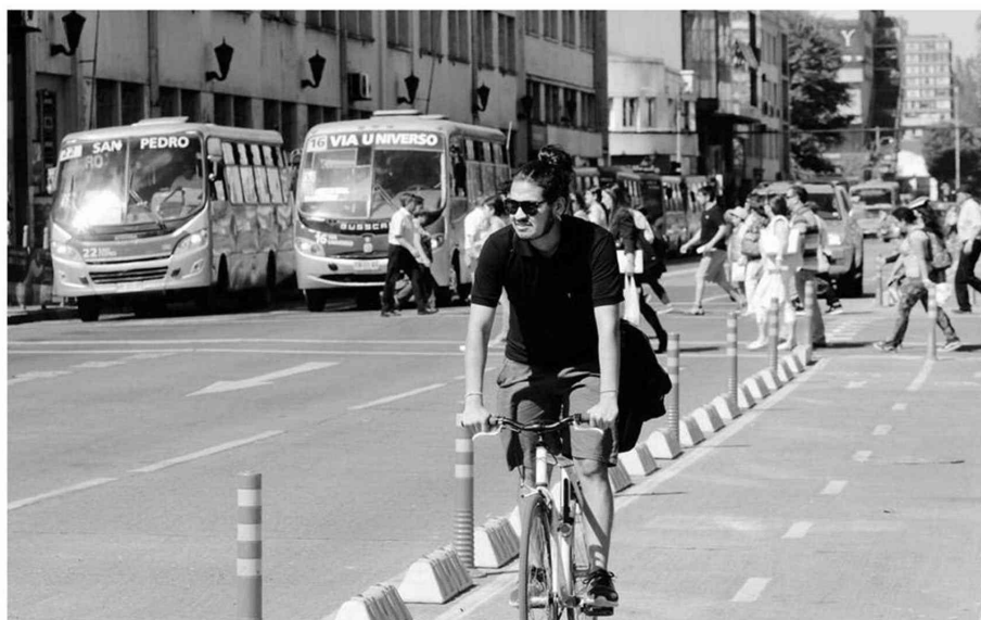
En los últimos 26 años aumentó el uso automóvil, se mantuvo el del transporte público y las bicicletas y motos duplicaron su uso, pasando del 1 al 2%.