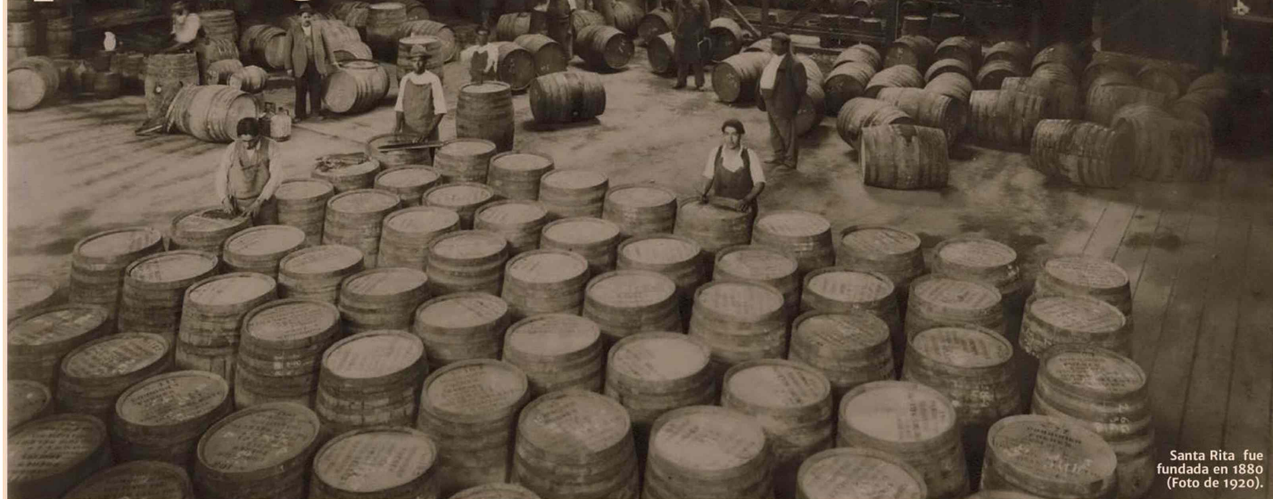
Santa Rita fue fundada en 1880 (Foto de 1920).