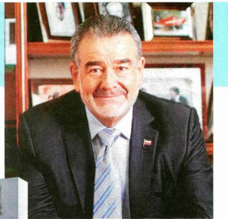
Andrónico Luksic "American Ulysses" relata las vivencias de un militar del Ejército de EEUU al final de la Guerra de Secesión.

A días del inicio de una nueva versión de la Feria Internacional del Libro, le preguntamos a algunos hombres de negocios qué leen y éstas fueron sus recomendaciones