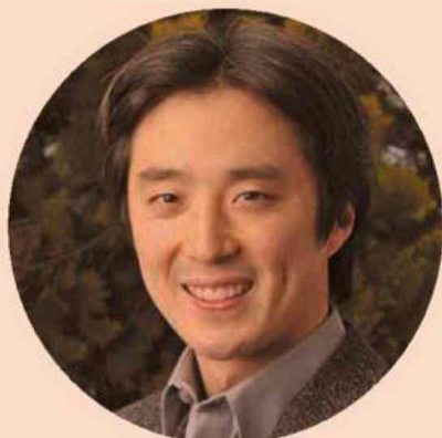
Kenzo Asahi Académico Escuela de Gobierno UC

Título: Menores de 13 años mejoran hasta en 31% sus ingresos de adultos, al mudarse a un barrio mejor