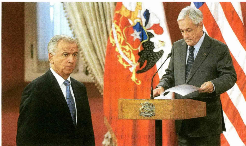
En Teatino 120 han trabajado intensamente en la propuesta.

Esta tarde el equipo que está trabajando el proyecto de reforma, encabezada por el ministro de Hacienda, Felipe Larraín, y el titular de la Dipres, Rodrigo Cerda, sostendrán una cita bilateral con el Presidente Sebastián Piñera para entregarle sus propuestas en materia impositiva.